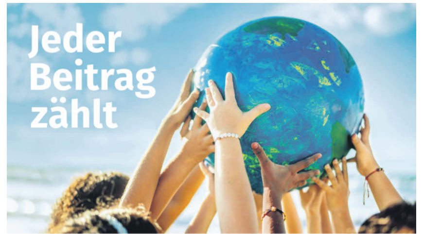
Frontbild Fastenkalender: Sehen und Handeln!

Ökumenische Kampagne 2024 Aschermittwoch, 14. Februar bis Ostersonntag, 31. März