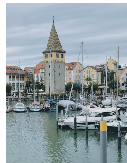
Bilder Rober Fürst