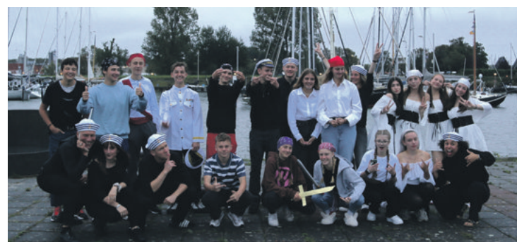
Impressionen aus dem Konflager