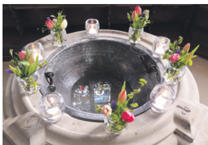
Schön geschmückter Taufstein in der Kirche Bätterkinder