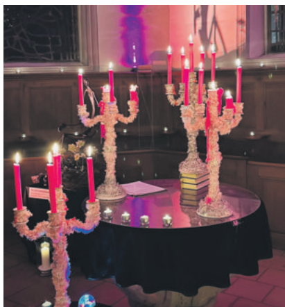
Pop-Taize-Feier, 17.1.2026

Weitere Bilder finden Sie auch immer in der Bilder-Galerie auf unserer Homepage.