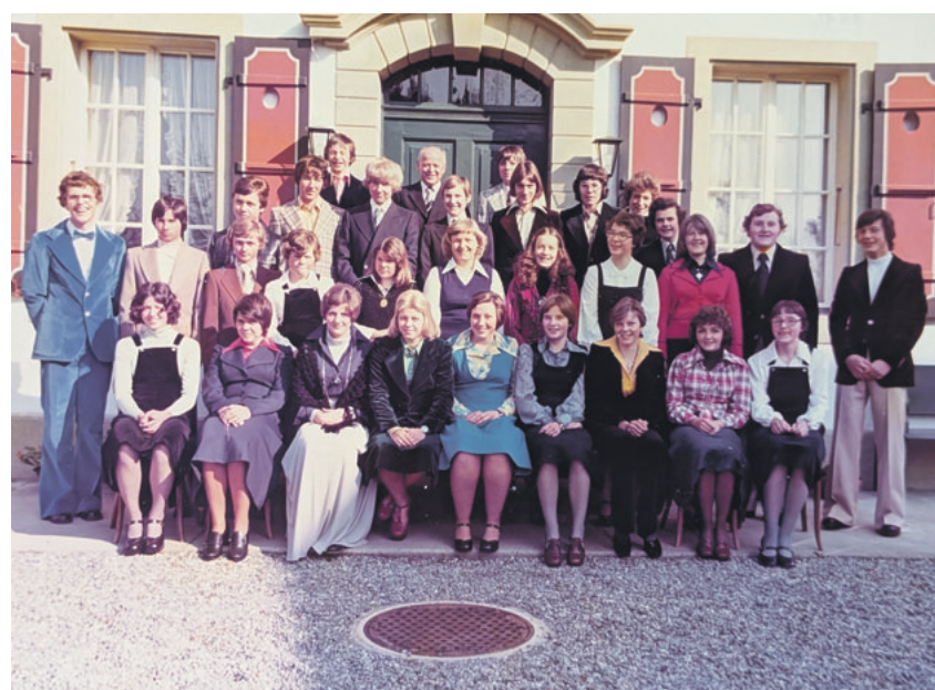
Konfirmation 1976 in Grafenried

In der Kirche Limpach gab's im 1976 keine Konfirmationen.