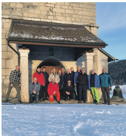
Männersache: Schneeschuh-Tour im Jura, 24.1.2026